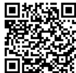
ตรวจสอบรหัสสมาชิก ส.บ.ม.ท.